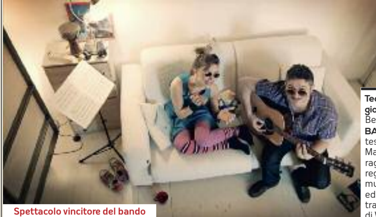
Spettacolo vincitore del bando "Residenze Bellandi"